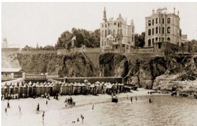
(El Salto jauregia, 1905ean, Portugaleteko hondartzaren gainean)

Areilza-k dioskunez 32 , eleberrian Bilbo Altorno da, Portugaleta Cabantes, Algorta Torcal, Areeta Playa Blanca. Areilza-ren etxea (El Salto) Casa Pilar bilakatu zuen. Allera Begoñako eliza da.