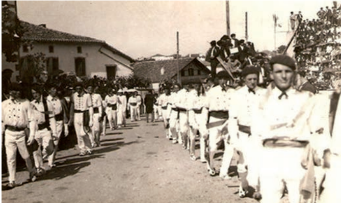
1937ko tobera Irisarrin. Dantzariak plazara sartzen.

Ematen duenez, herriko plaza jendez mukurua egon zen eta horietako asko bertako zuhaitzetara igo omen zen kabalkada-toberak hobeto ikusi ahal izateko. Jorratutako gaiak eztabaida handia piztu omen zuten baita bertara hurbildu zirenen arteko liskarrak eta kalapitak ere. Azkenean, ukabilkadaka bukatu omen zuten.