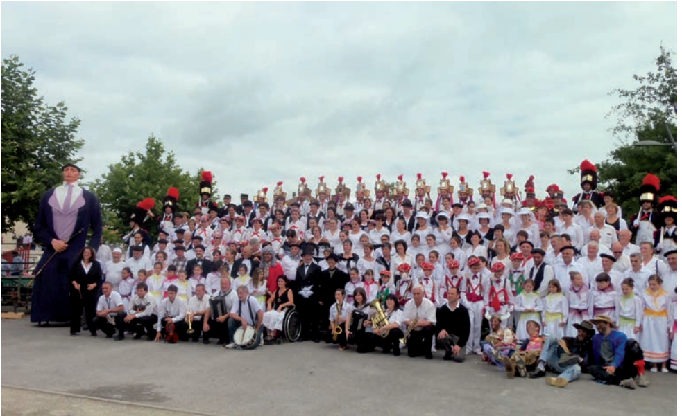
2012ko tobera. Parte hartzaile guztien argazkia

5.- Eta bukatzeko begitan zuen uxerra atxilotzeko eta zulo batera botatzeko agindu eman zien bertan ziren jendarme.