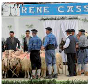
Artzainak, ardiak eta astoa oholtzan