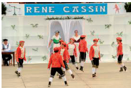
Satan dantza gogoangarria

Beste herririk badago, zapazaleen despit, esküak eman algarri, algar süstenga beti, güziak libra gitean, heben eta lürrean, denek batean etsaia sar dezagün sarean.