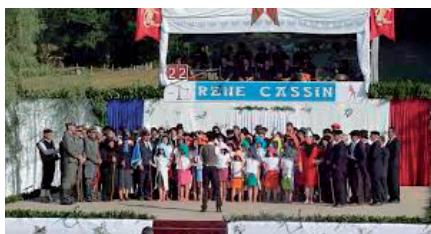
Arizale guztiak oholtza gainean kantuz