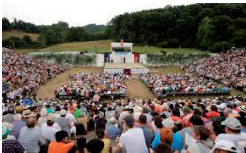
Harmailak jendez gainezka zeuden

76.- Han kolpatü naiana ez dit ezagützen, bena ni bezalako gizon gazte bat zen. Bizirik egoiteko gure tirokatzen, hebentik ari nüzü hura non ote den.