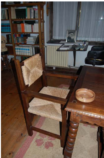
Gogozko bere eserlekua