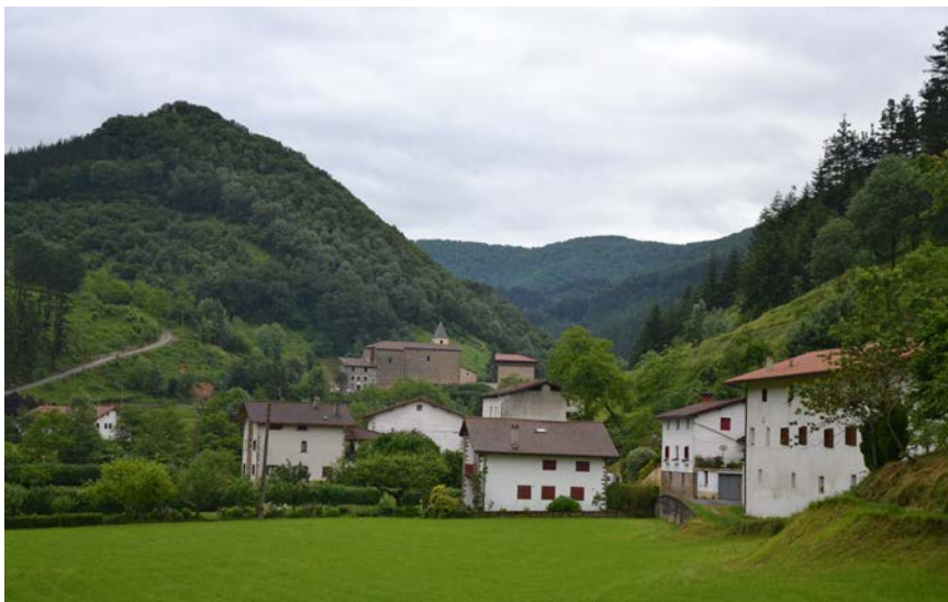
Barandiaran etxe ingurua

Ingurua ikertzen hasi eta Euskal Herriarekin egin zuen topo. Horrek ekarriko zion, gerora, bere bizitza zedarrituko zuen erbesteratze luzea, buruhausterik handiena: Ze eĩñ diat, ba, nik? Galdetzen zion etengabe bere buruari, batez ere, urtearen amaiera iristen zenean. “1939ko abenduaren 31n 50 urte. Euskal Herrian lan egin dut, bertan jaio eta euskaldun naizela. Zorritzarrez, garai honetan Euskal Herria ikasi eta aztertzea separatistoztat jotzen dira. Horregatik nago desterruan...”.