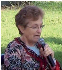
Hatsaren Poesia Egunean olerki bat irakurtzen. Amotzeko Larraldean. Senpere.

Azken urteetan unatzen hasia zen, eta bere burua akitzen. Berak ongitxo zekien hori, guztiz kontzientea zen, eta horrela kontatu zigun “Abulezia” izeneko olerkian: Xoriak ez du kanta- tzen, / olerkariak ez du bertsurik asmatzen, / egunero laino xu- riek / zeru urdina dute estaltzen. // Iduzkia, ilargia eta izarrak / ez ditugu ikusten, / ekialdeko haize minak / basaki dauku agur- tzen. // Banoa hartzairen harpera / borren ondoan lo egitera.