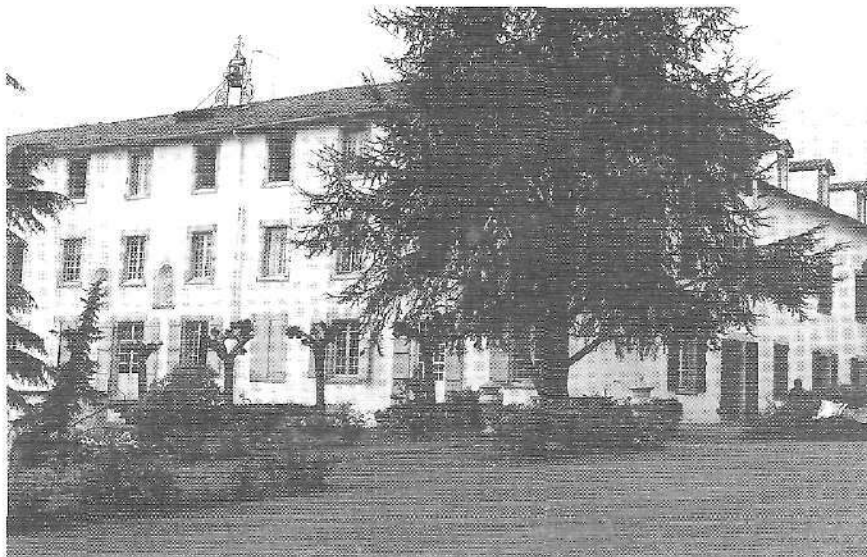
Ustaritzeko Gurutzeko Alaben etxea.

baretzeko, sendabide gogorrak agindu zituzten. Nahiz eta beharrezkoa izan ebakuntza, ni aurkitzen nintzen egoera anemikoak ezinezkoa egiten zuen. Hala ere, zortzi hilabete eritegian zaintzen egin ondoren, ongi sentitzen nintenez, behin eta berriro eskolak emateko baimena eskatu, eta Espainiara etortzeko baimena lortu nuen.